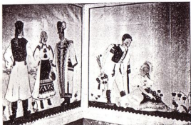
A MOGAAC-BÁL FALDISZITÉSE

Talán ezek a tiszta örömet sugárzó élmények tanítanak meg bennünket arra a sajátos életfilozófiára, hogy nincsen semmi olyan távol, ami — legalább lélekben, vagy fényesített emlékképben — ismét közel ne jöhetne. És semmi sincs olyan közel, hogy lassan el ne távolodna tőlünk. Lehet, hogy fiatal éveinkben ezért rejtünk el mélyen és gyakran tudatosan annyi sok szép emléket. Lehet, hogy már ilyenkor mentjük át a friss, mozgalmas élményeket a fáradt öregségbe. Úgy érzem, hogy mikor így átvonulok az elmúlt, három akadémiai év emlékrétegén, lassan megvilágosodik bennem a történések végső értelme: az egyetlen boldogító valami az emlékezés .