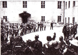
BÚCSÚZÁS A TANÁRI KARTÓL

Ekkor már mi rendeztük a „balek”-bált, 1936. október 8-án. Nem titkolható kárörömmel vonultunk fel a közönség előtt a mi előző évi félszegségünk nyomába lépett ifjú társaságot. 1937. január 15.: a Gazdászbál dátuma. Itt már ki-