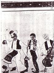
A MOGAAC-BÁL FALDISZITÉSE