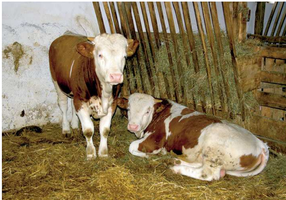
Az idősebb csoport hizóbikái

A termelő hozzáértése, odafigyelése olyan, hogy az állatok szeméből képes kiolvasni; mire van pontosan szükségük, elégedettek-e a takarmányozással. Nyitott könyv előtte az állomány; a betegséget és a jó közérzetet egyaránt nagy biztonsággal meglátja. Ennek eredménye minden évben a 24-25 db-os kibocsátás, és ugyanannyi a következő generáció hizlalása, illetve beállítása. A három-négyhavonta történő értékesítés után tehát már be is állítják a követ-