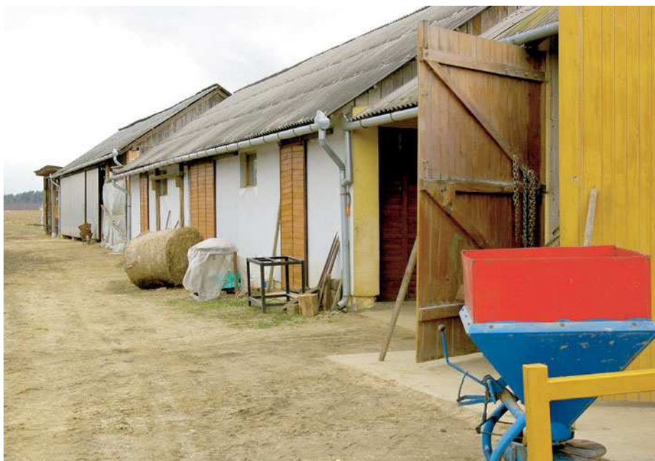
A gazdasági udvar hátsó fertálya

a feleségével való egyetértést és közös munkát emelte ki. Zalaháshágyi otthonuk folytatása a gazdasági udvar, ahol példás rend uralkodik. Kevéske kis géptámogatással vásároltak erőgépet, azon kívül a gazdasági épületek java részét saját erőből épültek. A takarmánykeverő helyiség után az istállók, a terménytároló és a gépszín funkcionális egységet alkot, és éppen kiszolgálja azt a tevékenységet, amelyet folytatnak, és aminek a méreteit nem is kívánják megnövelni. Mindhárom fiuk már pályára állt – de egyikük sem választotta a mezőgazdasági hivatást. A legidősebb villamosmérnök, a középső közigazdász, a legkisebb pedig informatikus hallgató. A két nagyobbik még otthon lakik, ezért amikor csak tehetik, és idejük is engedi, a fizikai munkából is kivesszik a részüket, jóllehet – kellő humorral – az istállót fitness-centerként aposztrofálják. A talicska a kondigép, a villa, a vödör, a lapát és a seprő a súlyzó, a gumicsizma pedig a mezőgazdasági tornacipő. Így persze, iróniával átszöve, egészen más a munka megítélése, a segítség pedig mindig jól jön a család portáján. Egyébként pedig a bikák mellett tíz malac is meghízik, évi kétszeri vágást biztosítva, ezzel fedezve a család élelmiszer-szükségletének egy részét. Andor Imre itt figyelmeztet arra, hogy a parasztember az életében azért nem mondhat és nem is mond le minden jóról. A disznóvágás, a borfejtés és a legalizált pálinkafőzés valamelyike csak maradjon meg, ha már mindhárommal úgyszem lehet egyszerre foglalkozni.